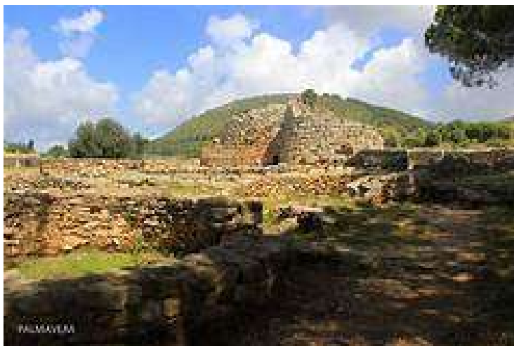
Villaggio nuragico Palmavera